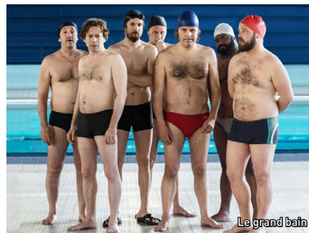
Le grand bain