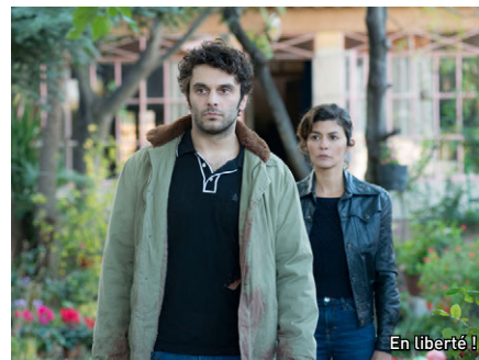
En liberté !